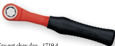
Tay gạt chạy dao - 1719 4