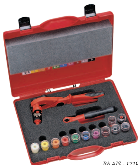
Bộ AIS - 1719 0