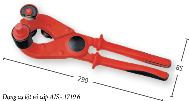
Dụng cụ lột vỏ cáp AIS - 1719 6